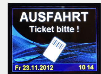
Abbildung 2 Displayanzeige bei der Ausfahrt