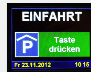
Abbildung 1 Displayanzeige bei der Parkhauseinfahrt