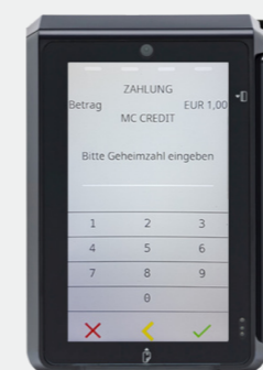
Abbildung 2 Eingabe der PIN auf dem Touchscreen